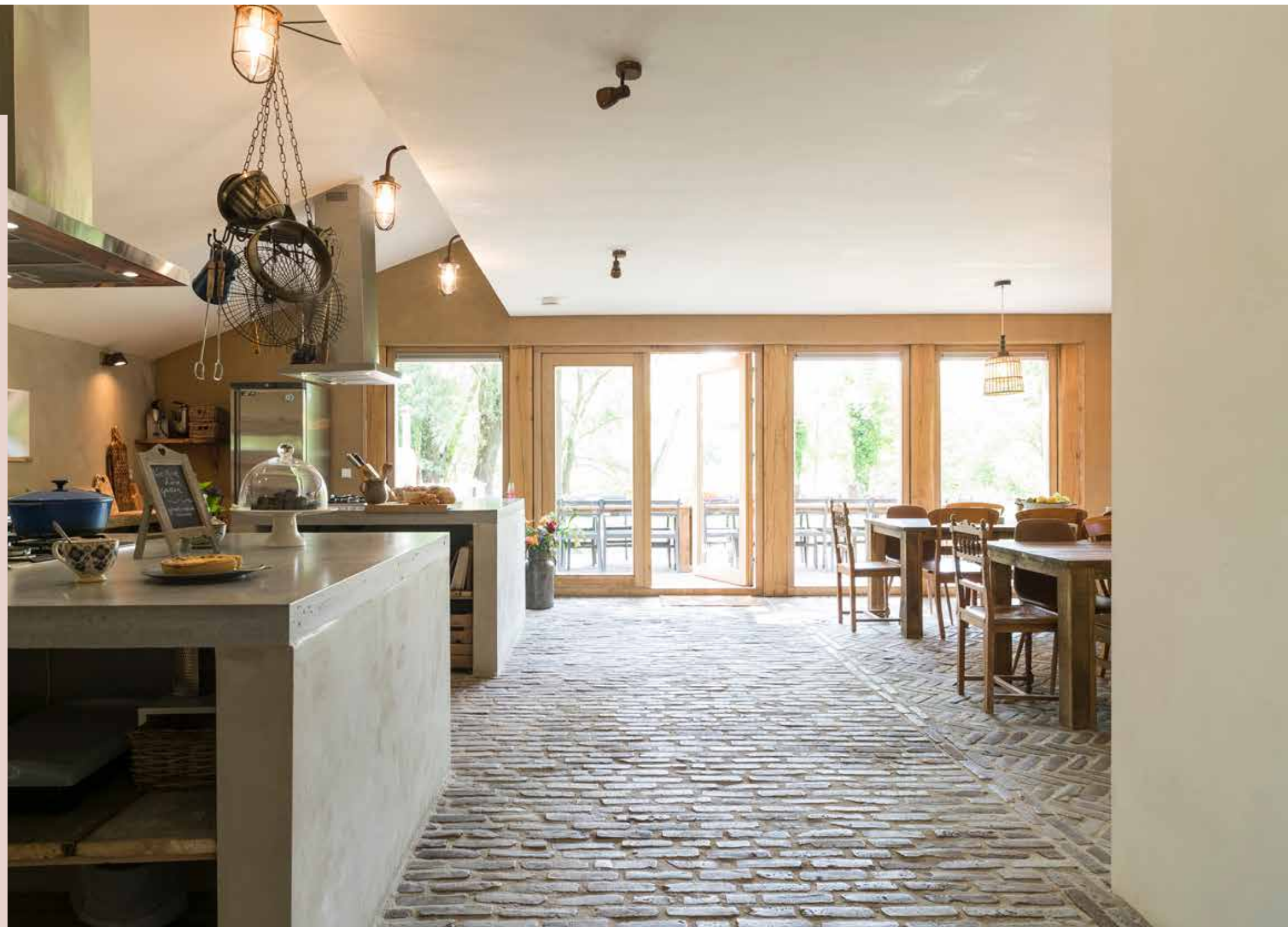
Een prachtig gitzwart La Canche fornuis siert de keuken waarbij twee ruime kookeilanden met een betonnen werkblad voor voldoende werkruimte zorgen.